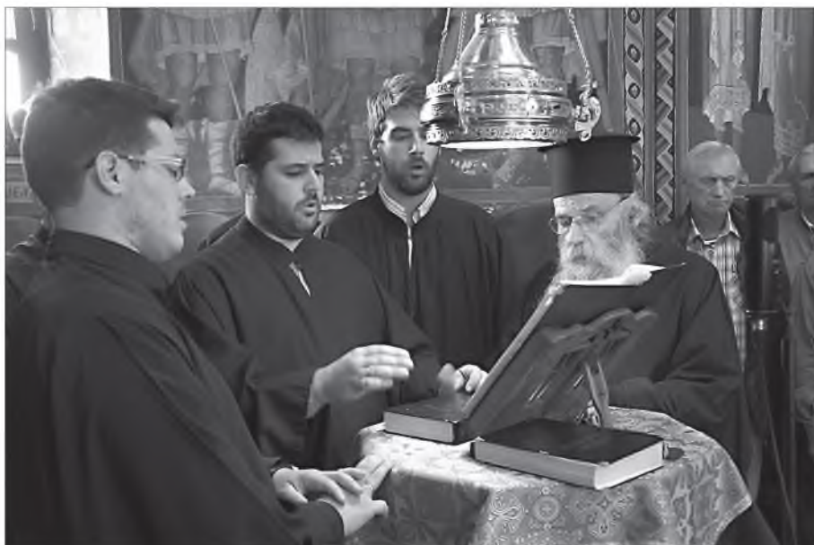
Византийская музыка в православном богослужении

Теперь скажем несколько слов о роли и месте византийской музыки в православном богослужении. Обычно говорят, что византийская музыка – это одежда, в которую облачается слово, учение, содержащееся в тропарях. Но святые отцы считают, что византийская церковная музыка – это нечто большее. Святитель Григорий, епископ Нисский, брат святителя Василия Великого, говорит, что музыка – это часть нашей природы и поэтому святой пророк Давид объединил в одно и музыку, и поучение в добродетелях. Музыка подобна сладкому мёду и, соединённая с наставлением, помогает человеку внимательнее взглянуть на себя и взяться за врачевание недугов. Ещё святитель Григорий говорит, что церковная музыка, простая и умирительная, проникает в слова божественных песнопений с тем, чтобы изъяснить скрытый в них таинственный смысл с помощью мелодических переходов голоса. Музыка – словно ароматная приправа, которая придаёт поучениям и наставлениям Церкви особый приятно-сладостный вкус 1 . Старец Паисий Святогорец 2 говорил, что в византийской церковной музыке