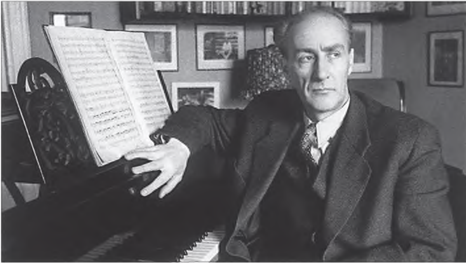
Работа над партитурой