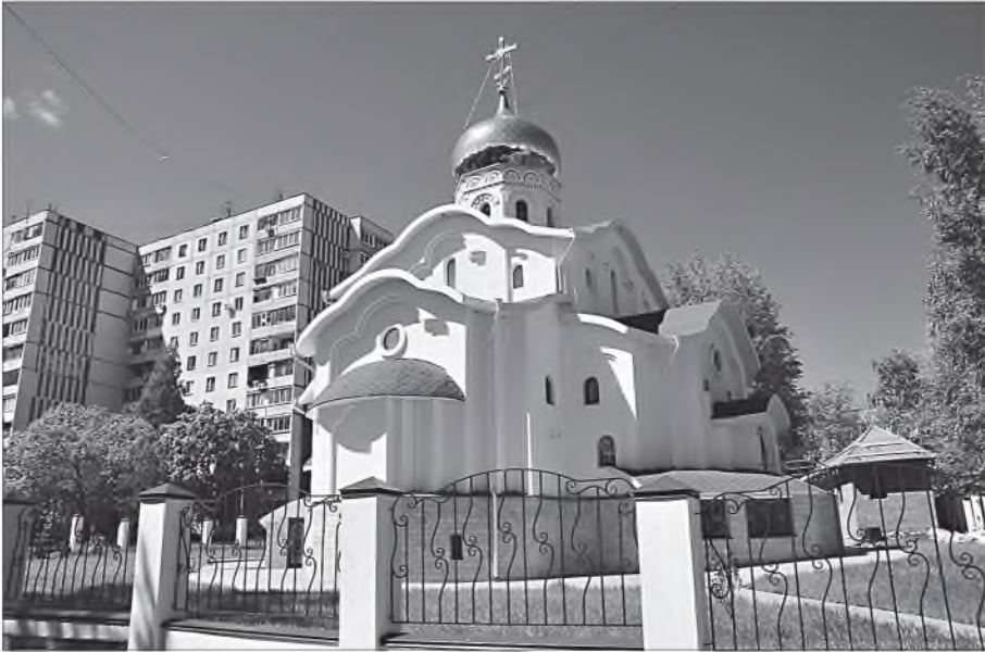
Храм в честь святых благоверных князей Петра и Февронии. Самара

рония помогла Петру, но как только он от неё уехал, опять заболел. То есть теперь надо было её при себе держать, не дай Бог, что случится, она всегда поможет.