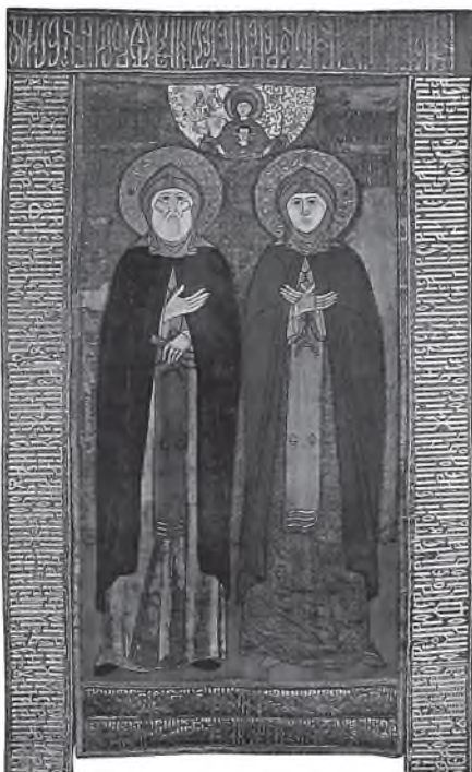
Покров с изображением святых Петра и Февронии – вклад в Богородице-Рождественский собор царя Фёдора и царицы Ирины в 1593 г.

Сегодня мы празднуем День семьи, почитаем благоверных князей Петра и Февронию. Князь Муромский Пётр жил в начале XIII века. Его поразила проказа – страшная болезнь, когда всё тело осквернено, покрыто струпьями, человек постепенно начинает разлагаться и умирает. И князь в поисках, кто бы мог его исцелить, объездил все грады и веси. Его помощники нашли одну девицу, Февронию, которая сказала, что она может исцелить Петра, но поставила условие, чтобы он взял её замуж. Вот такое дерзкое условие, даже непонятно, как его толковать и объяснять. Простолоудинка заявляет: «Исцелю, если князь возьмёт меня замуж».