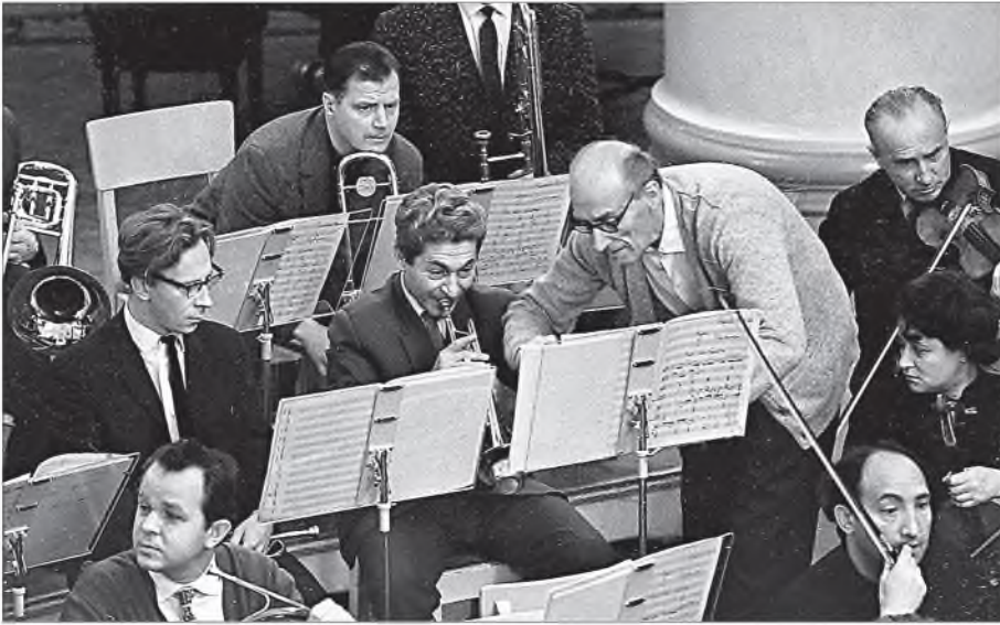
«Мравинский укреплял каждого, даже не замечая этого».