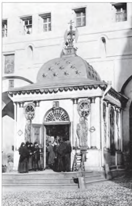
Иверская часовня у Воскресенских ворот в Москве