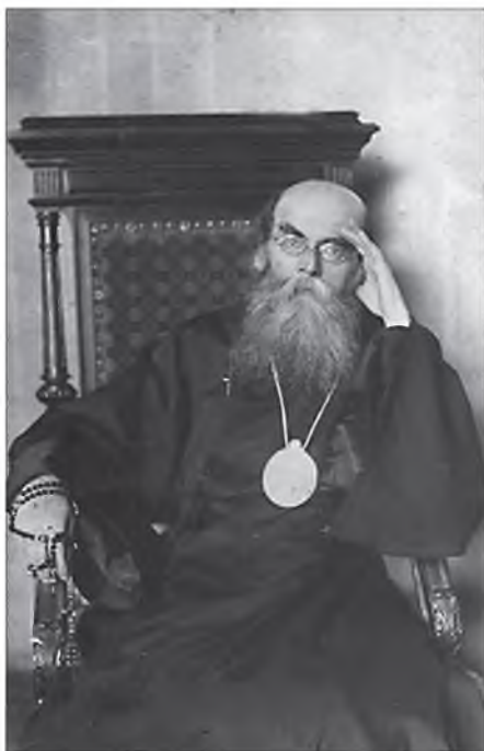
Митрополит Трифон (Туркестанов)

Однажды обличил Л. за дурные помыслы в церкви. Приложилась она к иконе и встала рядом с ним, а в голове у нее были дурные мысли. Он взял и оттолкнул Л. от себя. Тогда только она опомнилась, поняв, как несовместимы ее помыслы со службой Божией. Одна духовная дочь сказала митрополиту Трифону 1 : «Как много народа в церкви!» – «Да что там народ! Один там был Трофимушка, он один и молился!» – ответил митрополит.