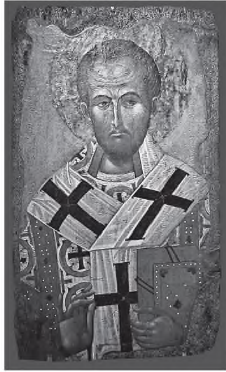
Святитель Иоанн Златоуст. Икона. XV век.

Так как диавол строит козни большею частью во время пиршеств, при помощи упоения, пресыщения, непристойного смеха и душевного расслабления, то особенно тогда, и пред трапезою и после трапезы, нужно защищать себя от него оградою псалмов и, вставши из-за стола, вместе с женою и детьми воспевать Богу священные песни. Если Павел, имея на себе нестерпимые раны, нося на ногах колоду и находясь в темнице, в полночь, когда все покоятся особенно сладким сном, вместе с Сиолом воспевал славословие Богу, и ни место, ни время, ни заботы, ни склонность ко сну, ни утомление от тяжких трудов и ничто другое не принудило его прекратить песнопение, – то тем более мы, наслаждаясь благоденствием и дарами Божиими, должны возносить Богу благодарственные песни, чтобы, если от упоения и пресыщения войдет в нашу душу что-нибудь нечистое и порочное, псалмопением прогнать все нечистые и порочные пожелания. И как многие из богатых, намочив губку бальзамом, вытирают ею столы, чтобы, если останется от кушаньев какое-нибудь пятно, стереть его и сделать стол чистым, так точно будем