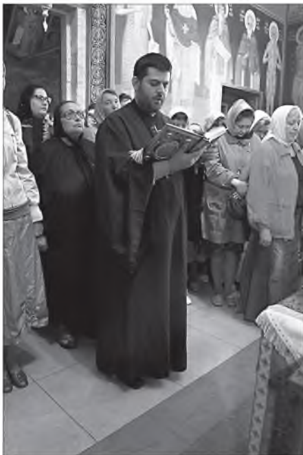
Византийская музыка служит великому таинству общения Бога и человека

но не портит древнего произведения, выказывая тем самым в себе недостаток благочестия.