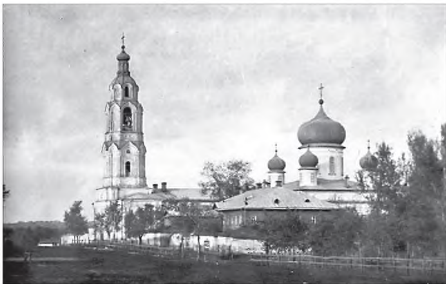
Александрo-Невский Кирило-Белозерский мужской монастырь