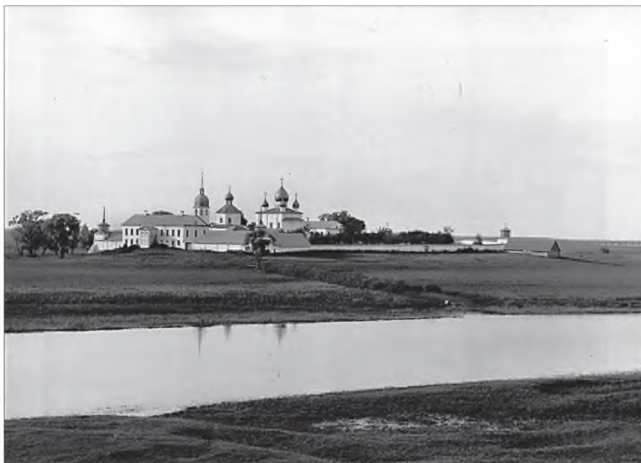
Кириллов монастырь в Великом Новгороде