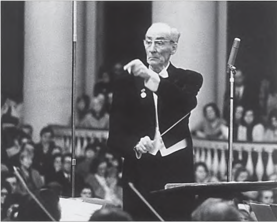
«Чуть ли не главным средством искусства Мравинского являлся взгляд...»

вдалеке шел поезд. Он шел гулко; было слышно позвякивание и погромыхивание; долго он шел и шел, не приближаясь и не удаляясь.