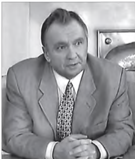
Александр Сергеевич Панарин

В опрос о цивилизационном и политическом самоопределении России сегодня стоит очень остро: никому не ясно, как поведет себя «загадочный гигант» после завершения нынешнего смутного периода. На своих развилках история бывает максимально открытой, отзывающейся на такие субъективные факторы, как воля элит, настроения народа, модные учения времени. Однако логика, диктуемая долгосрочными факторами существования – цивилизационными, геополитическими, экономическими, все же присутствует в истории. Она не