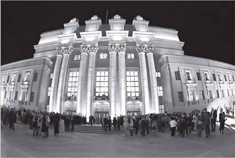
Самарский академический театр оперы и балета

что из этой ложи хорошо видно, как я иногда ругаюсь, иногда делаю то, что из зала не заметишь. Когда я только пришел в театр, барьер за спиной был еще не такой высокий, и я стоя дирижировал.