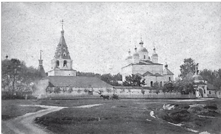
Лужецкий Рождества Богородицы Ферапонтов мужской монастырь в Можайске