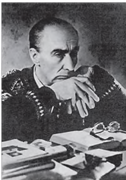
Евгений Александрович Мравинский. 1963 г.

О великом музыканте и дирижере Евгении Александровиче Мравинском (1903 – 1988) написаны сотни страниц – серьезные музыковедческие труды, вдохновенные эссе, восторженные рецензии. Но ни одно из произведений не способно столь же полно представить нам эту выдающуюся личность, как его дневниковые записи. Из них, конечно, можно вычитать какие-то факты, касающиеся музыкальной жизни Советского Союза. Но они весьма немногочисленны, поскольку Мравинский стоял как бы в стороне, он словно бы приходил в профессию откуда-то. Две трети его записей представляют описания природы. Мравинский наблюдает; наблюдает очень