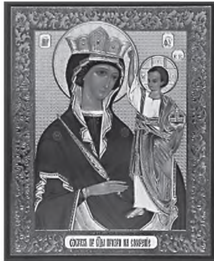
Образ Пресвятой Богородицы «Призри на смирение»

По слову святого Варсонофия, смирение есть мать всех добродетелей и имеет первенство между добродетелями. Смирение есть сокращенное спасение. Смирение соделывает человека селением