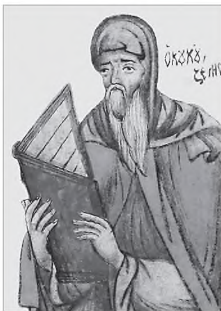
Святой Иоанн Кукузель

Однажды Иоанн пас своё стадо и, посещённый божественным вдохновением, запел своим изумительным голосом. Рядом с тем местом находилась пещера некоторого пустытника. Услышав это ангельское пение, он вышел из пещеры и с удивлением увидел, что животные стоят неподвижно и слушают певца. Он рассказал об этом игумену. Тот призвал святого Иоанна, расспросил, кто он на самом деле, а потом отправился к императору, чтобы сообщить, что Иоанн нашёлся и просит разрешения проводить мирно монашескую жизнь. Начиная с этого времени Иоанн стал жить в келье возле Лавры и по воскресеньям и большим праздникам петь в соборном храме монастыря. Однажды на всенощной в Субботу Акафиста Иоанн заснул. Во сне ему явилась Божия Матерь, похвалила за рвение и повелела