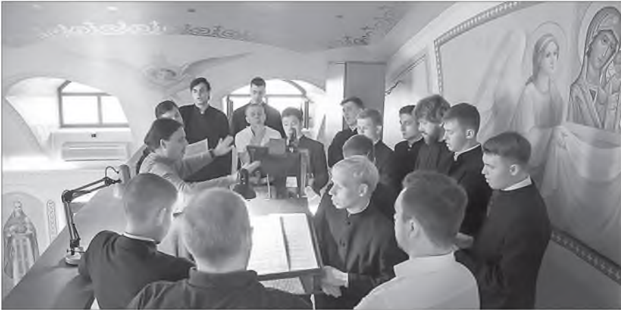
«Благослови, душе моя, Господа...»

ли ты? Сидя в мастерской и занимаясь работой, ты можешь петь. Воин ли ты, или заседаешь в суде? Можно делать то же самое.