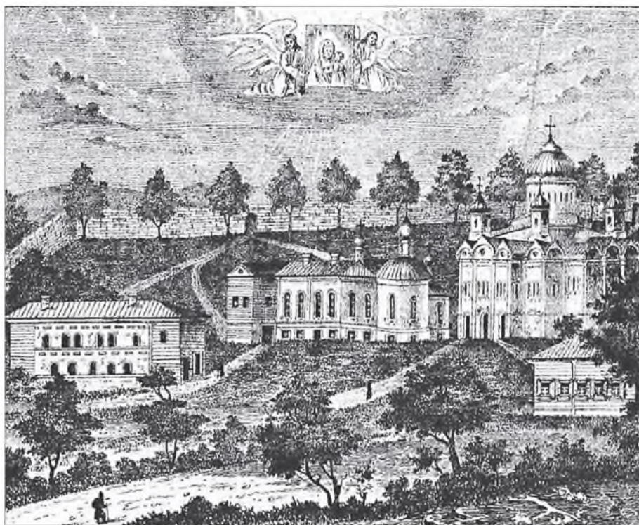
Таволжанский Казанский женский монастырь