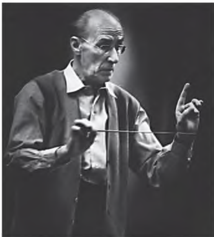
«Я... посредник между автором и слушателями»