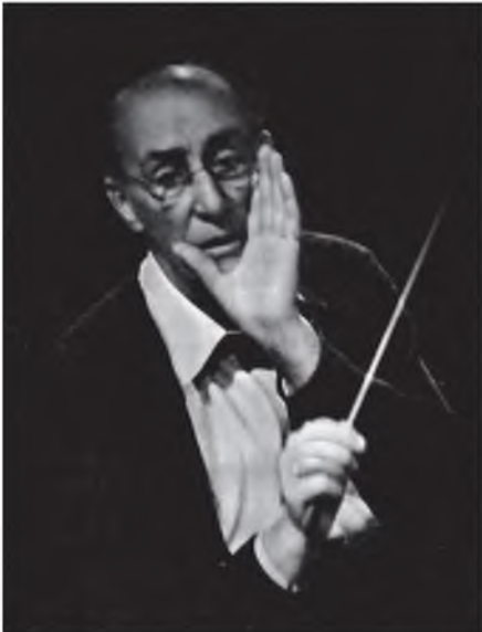
«...Верю во всепобеждающую силу музыки»

Идя домой, ясно ощутил близкую-близкую последнюю разлуку одного из нас с другим. И именно одного из нас, ибо другой тогда знать об этой разлуке уже не будет... Боже мой! Как надо любить друг друга! Как надо радоваться друг другу! Неотрывно. Непрестанно.