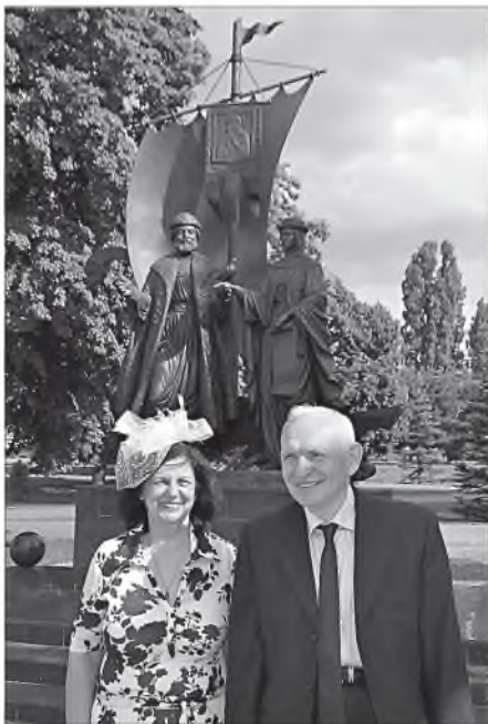
Золотая свадьба православной семьи. У памятника святым Петру и Февронии в Самаре

такой приготовили, с перегородочкой, один на двоих. На склоне лет они приняли монашеский постриг. И бояре рассудили, что неудобно монаха и монахиню в одном гробу хоронить. Князя похоронили у кафедрального собора, а супругу его – в женском монастыре, каждого в своём гробу. А утром бояре смотрят, они оба в том гробу, с перегородочкой, лежат. Как так? Непонятно. Чудо случилось. Поняли тогда все, что на это особое Божие произволение, похоронили их вместе.