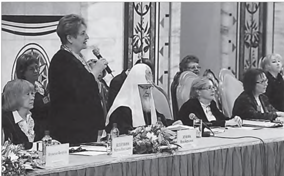
Второй Форум православных женщин. 2012 г.

в мешочках лежать! Министр культуры такие решения поддерживал. Позже всех, в январе 1992 года, передали Церкви мощи преподобного Серафима Саровского, потому что долго не могли их найти. В каждом отдельном случае по идентификации мощей я писала письмо Патриарху Алексию II: “Пришлите, пожалуйста, комиссию, которая проведет соответствующую экспертизу”, – а он всегда мне отвечал: “Я доверяю вашим сотрудникам и работникам музея”. Он знал: пока отдают, нужно поскорей забирать, а то вдруг завтра опять все переменится, запретят трогать “музейные экспонаты”, вернется антирелигиозная пропаганда? Время такое было... переходное».