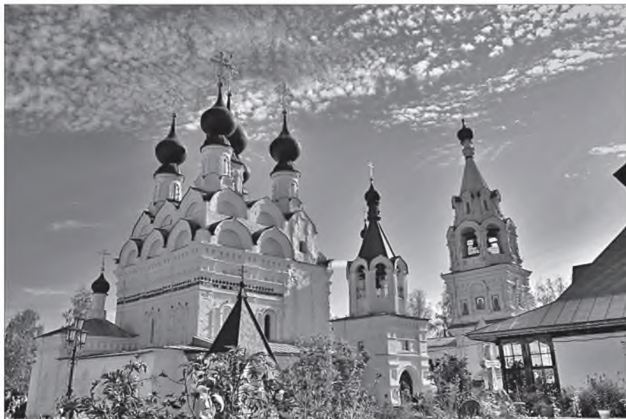
Свято-Троицкий женский монастырь. Муром

которые в глазах семьи были бы великой драгоценностью, чтобы они жили так, что не ценить их невозможно.